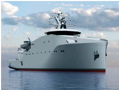
Un primer diseño de los futuros buques a ejecutar. VIVA

El Ministerio de Defensa y Navantia firmaron el pasado diciembre la orden de ejecución para la construcción de estos dos buques, que permitirán a la Armada renovar su Flotilla Hidrográfica, avanzando además en la transi-