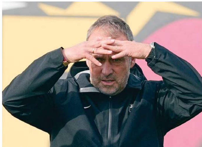
El técnico alemán del FC Barcelona, Hansi Flick, durante el entrenamiento de ayer.