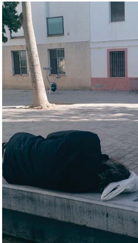
Una persona sin hogar duerme frente al albergue. NADIE SIN HOGAR