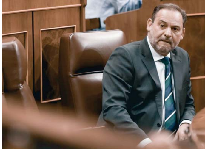
El exministro José Luis Ábalos en el Congreso de los Diputados.

Sin embargo, aclara el juez, la Audiencia Nacional deberá continuar con la investigación respecto a todos los demás imputados -que llegaron a sumar en torno a una veintena-, y también respecto a hechos atribuidos a De Aldama y Koldo García que no guarden relación con Ábalos, como presuntos delitos contra la Hacienda Pública y/o de blan-