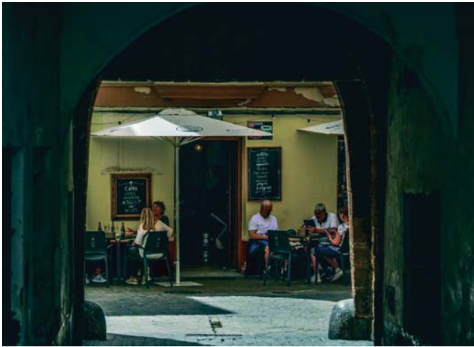
Las previsiones hoteleras para este puente en Cádiz son inferiores al del año pasado, según Horeca. VIVA