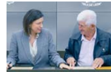
La firma del convenio. VIVA

El acuerdo contempla una subvención nominativa de 41.250 euros dentro de los Presupuestos de 2024