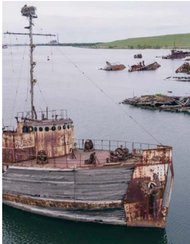
Zona de desguace de buques en el sudeste asiático.

Además las instalaciones de reciclado de buques autorizadas se ven afectadas porque el traslado y gestión irregular de los buques al final de su vida útil en centros no autorizados supone una situación de competencia a precios muy inferiores