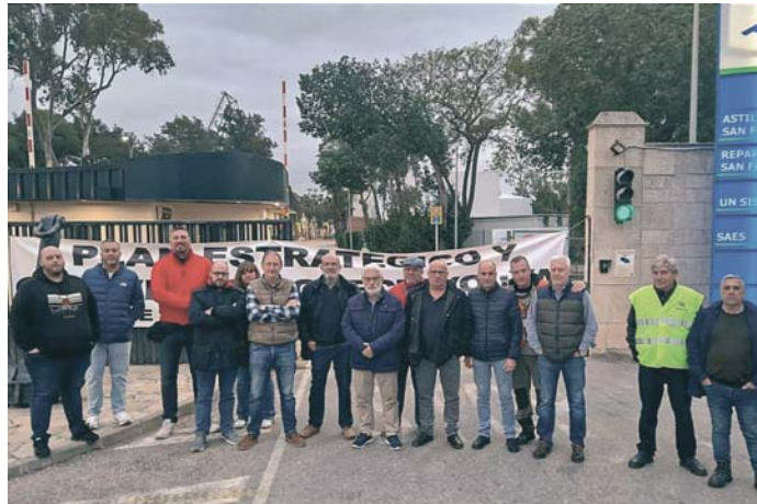
Los miembros del comité de empresa de Navantia San Fernando a la puerta del astillero isleño.