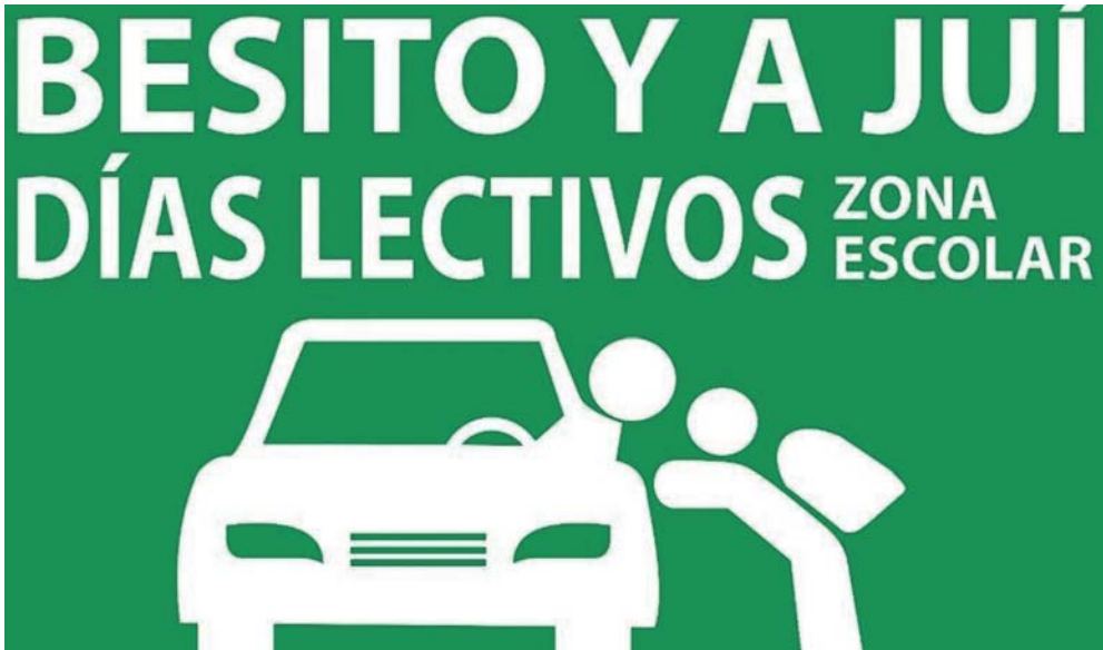
Detalle de la original señal vertical del Ayuntamiento de La Línea para impedir el colapso en el tráfico a la entrada y salida de los centros educativos.

NOVEDAD La Línea advierte a los padres y madres de realizar paradas cortas para despedirse de sus hijos en los colegios con una original señal vertical