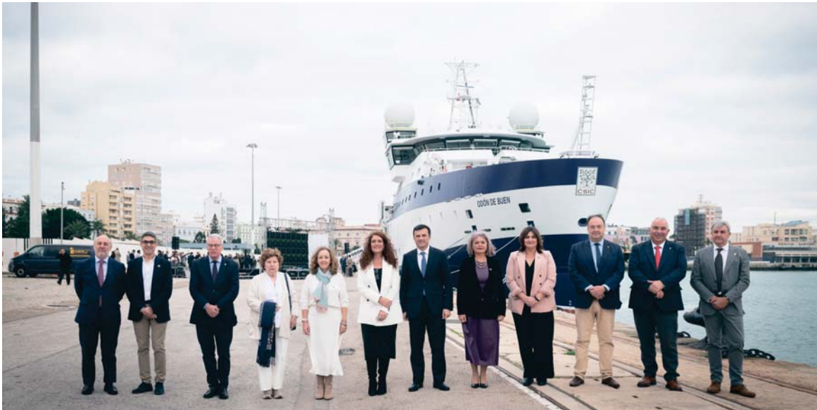
Autoridades asistentes al acto de amadrinamiento del buque oceanográfico Odón de Buen, el más grande con el que cuenta España y futuro referente en la investigación. VIVA

CIENCIAS MARINAS El barco, de 84,3 metros de eslora, servirá para el trabajo de 38 científicos en todos los océanos