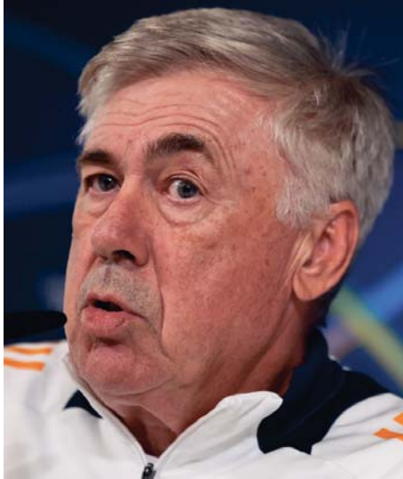
Carlo Ancelotti en la rueda de prensa.

Centrado ya en una semana importante, Carletto enfocó el primero de los dos partidos