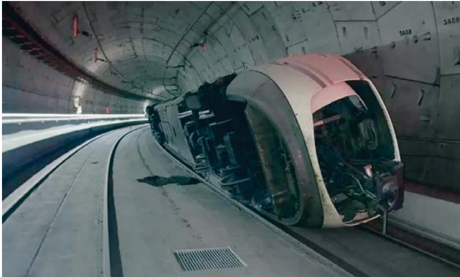
Estado en el que quedó el tren descarrilado en el túnel que une en Madrid las estaciones de Atocha y Chamartín.