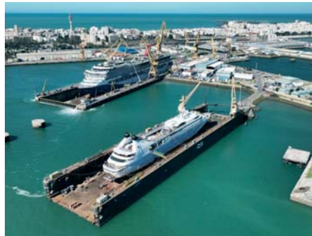
Cruceros en reparación en el astillero de la capital gaditana.

“El sector no puede vivir sólo de anuncios y expectativas de futuro”, ha advertido Romaní, quien ha mantenido reuniones recientemente con los representantes de los trabajadores para expresarles el apoyo del PP a las demandas no satisfechas por el Gobierno de Pedro Sánchez.