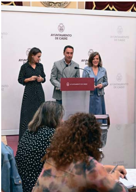
Presentación de la agenda municipal paralela al South Festival. VIVA

SERIES Entre los días 24 y 31 de octubre