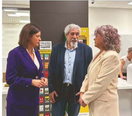
Correos estrena su segunda sede en San Fernando. VIVA

La nueva sucursal es una respuesta a la alta demanda de servicios en la ciudad y se suma a la oficina ya existente en la calle Real, fortaleciendo