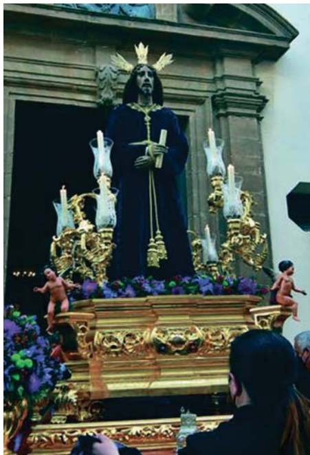
Jesús de la Sentencia, en el traslado de 2022. EULOGIO GARCÍA

Asimismo salió adelante, también por unanimidad, la revisión y conservación de la imagen de Nuestro Padre Jesús de la Sentencia, la cual ha mantenido su estabilidad material tras 30 años de su restauración original, realizada en 1994 por el imaginero Juan Manuel Miñarro. Esta imagen, datada en el siglo XVI, es la más antigua de la Semana Santa de Cádiz, y ha estado siempre bajo la supervisión del restaurador.