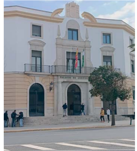
Imagen de archivo de la Audiencia Provincial de Cádiz.

Esta sentencia de conformidad fue leída el 26 de junio en la Sección Tercera de la Audiencia Provincial de Cádiz, y en ella el hombre admitió haber abusado de la niña en su casa, a la que había ido por ser amiga de su hijo de la misma edad, para limitar una pena de prisión de dos años, en la que no tendría que entrar siempre que cumpliera las medidas incluidas, como no acercarse a la víctima a menos de 400 metros durante siete años.