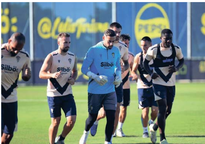
La plantilla del Cádiz CF, entrenando ayer por la mañana en la Ciudad Deportiva Bahía de Cádiz.

Algo mejor jugando como visitante lejos del Nuevo Mirandilla, el equipo gaditano espera retomar cuanto antes el camino de La Victoria. Y Eibar es la primera oportunidad para conseguirlo.