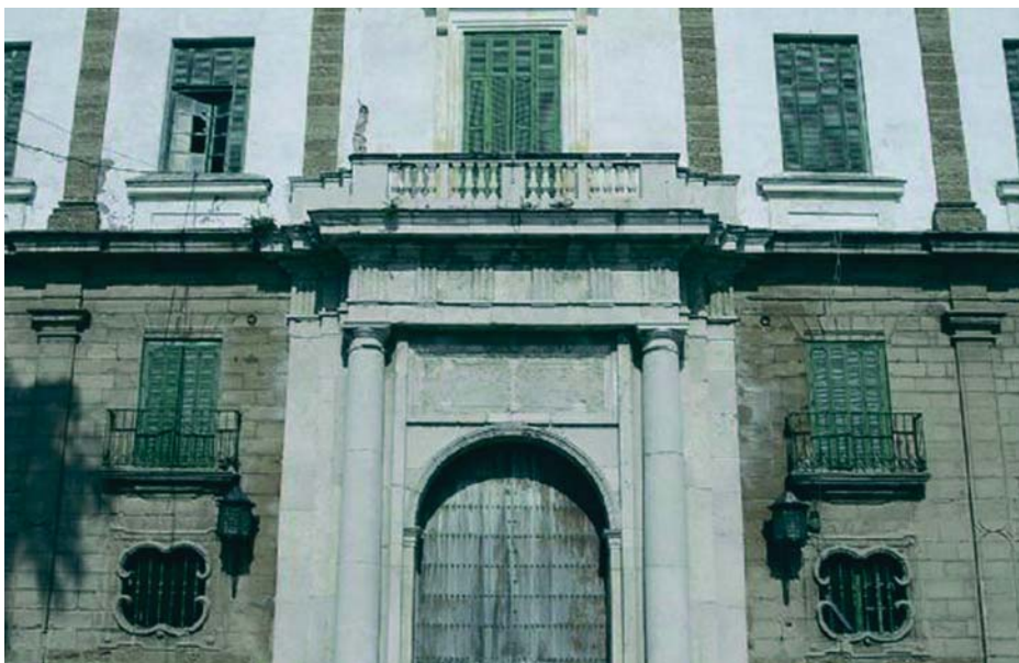
Las instituciones implicadas en la rehabilitación de Valcárcel imponen el hermetismo sobre la negociación para la rehabilitación y su uso. VIVA

UNIVERSIDAD Ayuntamiento, UCA, Junta y Diputación se reúnen pero eluden dar detalles