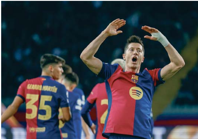
El delantero azulgrana Lewandowski celebra su gol 100 en 'Champions' marcado de penalti.

Guiado por una versión superlativa del centrocampista canario, y con la aportación destacada de un in-