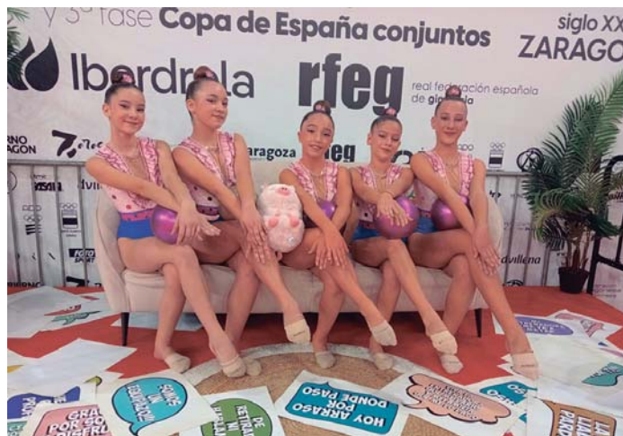
El equipo del Club Gimnasia Rítmica Kandela que se desplazó hasta Zaragoza para competir.

GINNASIA RÍTMICA Copa de España de Conjuntos