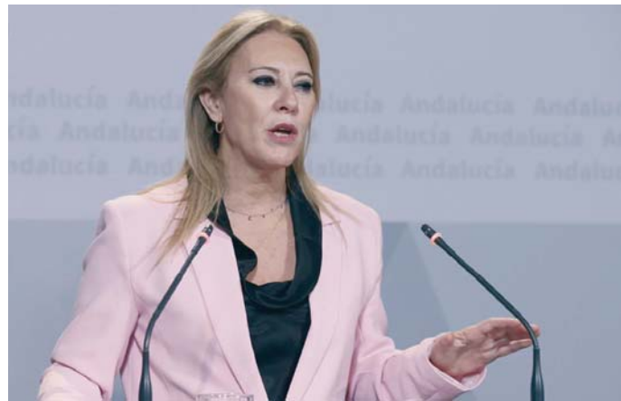
La consejera de consejera de Economía, Hacienda y Fondos Europeos, Carolina España.

Carolina España indicó que el Gobierno andaluz está "en desacuerdo" con la política fiscal que aplica el Ejecutivo de la nación, de la "asfixia fiscal" a la que somete a los ciudadanos, ya que el esfuer-