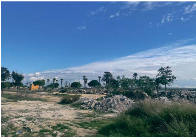
Así se encuentran los terrenos que albergarán el parque de La Magdalena tras dos años de parón.

La idea del Ejecutivo local, de hecho, es que la actividad en estos terrenos de 125.000 metros cuadrados, con un plazo de ejecución de 12 meses, puedan retomarse también a principios de año. De cumplirse las previsiones, los trabajos, con una inversión de 13,6 millones, coincidirán con el inicio de las obras de otro proyecto de mandato: la remodelación del estadio de fútbol. De hecho, sendos proyectos están incluidos en la partida de inversiones de los presupuestos de 2025, cuya aprobación provisional salió adelante el pasado viernes en