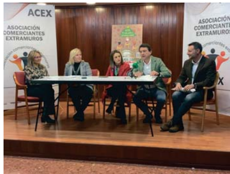
Presentación de la campaña de Navidad de ACEX. VIVA

La campaña de estas fiestas promete, además, cosechar un mayor éxito dado que gracias a la ayuda prestada por el Ayuntamiento, ofrecerá a los clientes de sus establecimientos la posibilidad de obtener como regalo 26 entradas platino para el Festival Puro Latino en El Puerto, con rasca y