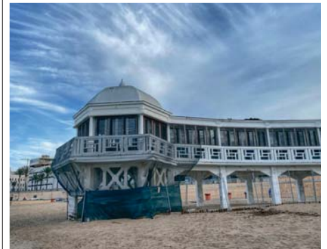
La Junta ejecuta obras en el antiguo Balneario de la Palma. VIVA