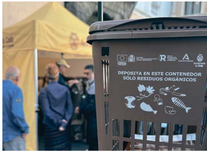
Imagen de la campaña municipal para la implantación del contenedor marrón para residuos orgánicos. VIVA