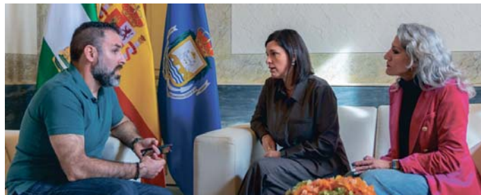
El nuevo intendente de la Policía con la alcaldesa y la delegada de Desarrollo de Administración. AYUNTAMIENTO

Policía Local de Cádiz. Una vez finalizado este periodo, se incorporará de manera definitiva en el primer trimestre del próximo año como Intendente de la Policía Local de San Fernando, que es la plaza de mayor categoría dentro del cuerpo de la Policía Local en la ciudad. Un total de once aspirantes se presentaron a la plaza de intendente del 091 en La Isla para cubrir la plaza, vacante desde 2022 tras jubilarse su predecesor.