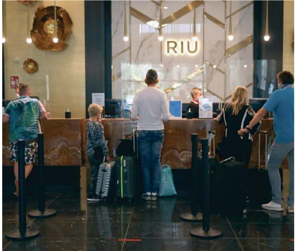
Viajeros en la recepción del Riu Palace Oasis Maspalomas.

Los obligados son los hoteles, hostales, pensiones, casas de huéspedes, hostales de turismo rural, cámpines, zonas de autocaravanas, apartamentos, bungalows, entre otros