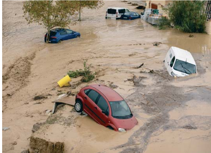
Estado en el que quedaron los coches tras el desborde del Guadalhorce en Álora (Málaga).

La Guardia Civil y el Consorcio Provincial de Bomberos de Valencia buscan al camionero desaparecido que se encontraba trabajando con su vehículo sobre las 13:00 horas