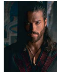
El actor turco Can Yaman.

En la agenda de este miércoles destaca la presencia de Can Yaman, actor turco conocido por haber protagonizado las series Dolunay, Bay Yanlis y Erkenci Kus. Esta última lo