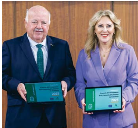
Jesús Aguirre y Carolina España en la Cámara Autonómica.

De los 48.836 millones, un total de 28.540 millones proceden del sistema de financiación autonómica, un 3,7 % más (1.000