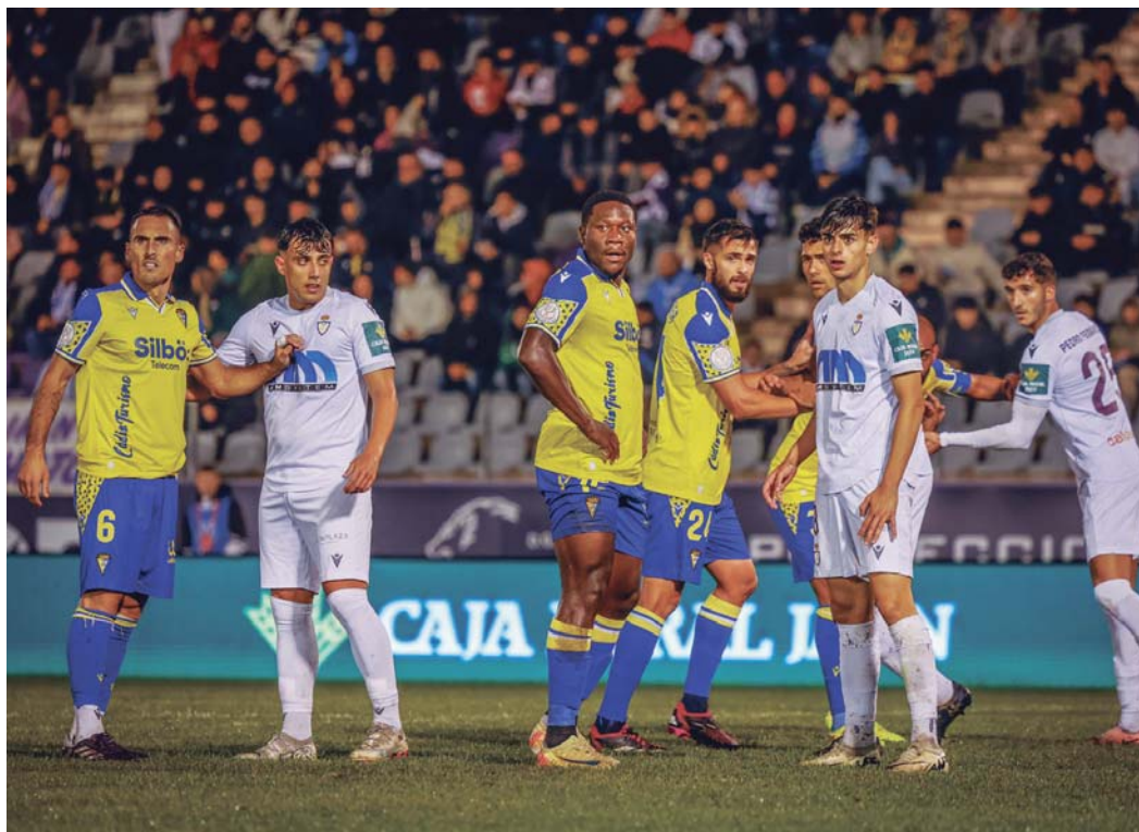
El Cádiz CF alineó en Jaén a los futbolistas menos habituales en el campeonato liguero para repartir minutos y dar descanso a los titulares.

■ Lesionado desde antes de disputarse la jornada 2, el delantero ya está dispuesto para ayudar con sus goles