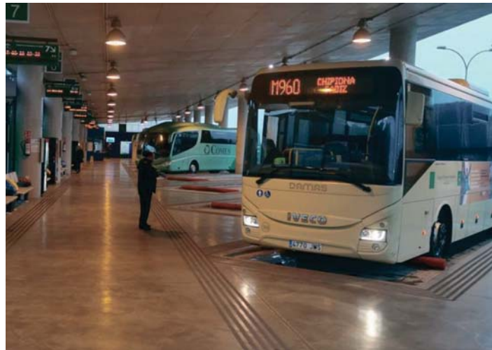
Facua Cádiz ha denunciado fraude con la tarjeta del Consorcio de Transportes de la Bahía de Cádiz. VIVA

En el anuncio se invita a los interesados que deseen acogerse a la oferta a acceder a un enlace para tramitar el pedido. Tras efectuar dicho acceso, se redirige a una web que suplanta a la del Consorcio y tras responder a un cuestionario de tres preguntas y resolver un breve acertijo se inicia el proceso de cobro, para lo que se exige al usuario facilitar los datos personales y de una tarjeta bancaria.