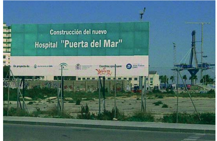
Imagen de archivo del cartel anunciador del nuevo hospital, que hoy apenas puede leerse. EULOGIO GARCÍA

Y, finalmente, en movilidad, ha reseñado que el Trambahía contará con 14,58 millones, mientras que el Consorcio Metropolitano de Transportes de la Bahía de Cádiz va recibir 17,3 millones de euros, en el marco de los cuales más de 1,45 millones van destinados a la adquisición de catamaranes para el servicio que presta entre los municipios de Cádiz, Rota y El Puerto.