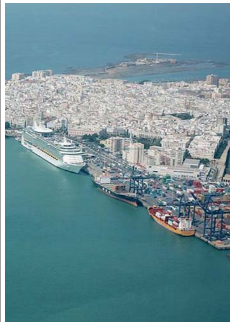
Imagen de archivo del Puerto de Cádiz. VIVA