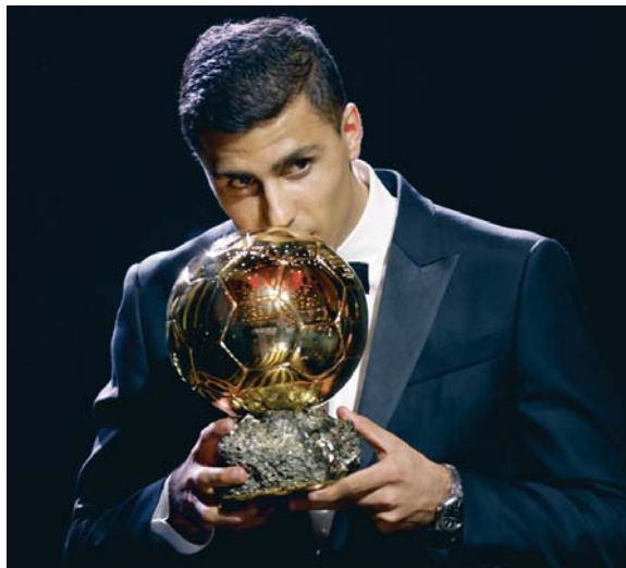
Rodri besa el trofeo al mejor jugador del mundo.

“Es irremplazable”, ha dicho siempre Guardiola de su mediocentro, al que ha considerado fundamental para los éxitos en los últimos cinco años. Y