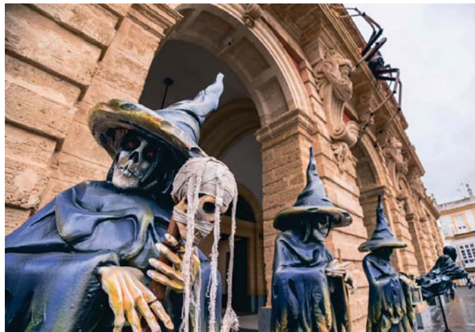
La fachada del Ayuntamiento se vistió ayer de Halloween para dar la bienvenida a los visitantes. AYUNTAMIENTO

En sus últimos partes, la Aemet da un 100% de lluvia para las jornadas del jueves 31 de octubre, la noche de Halloween propiamente, que en La Isla se alarga más que en cualquier ciudad. Unas esti-